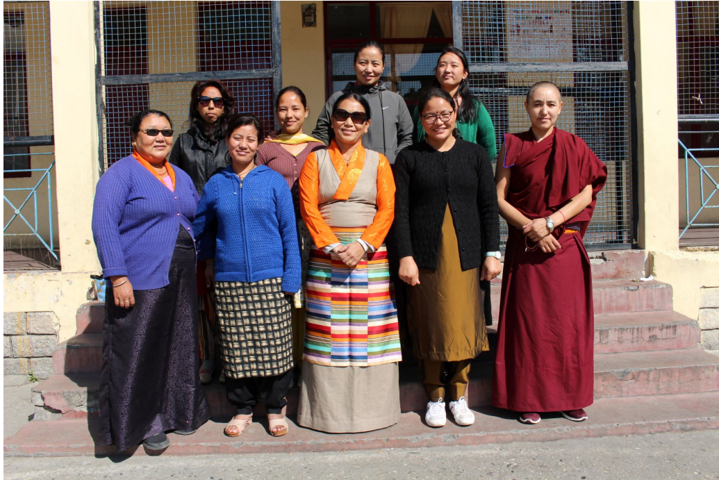
Leraren en verzorgers van de school