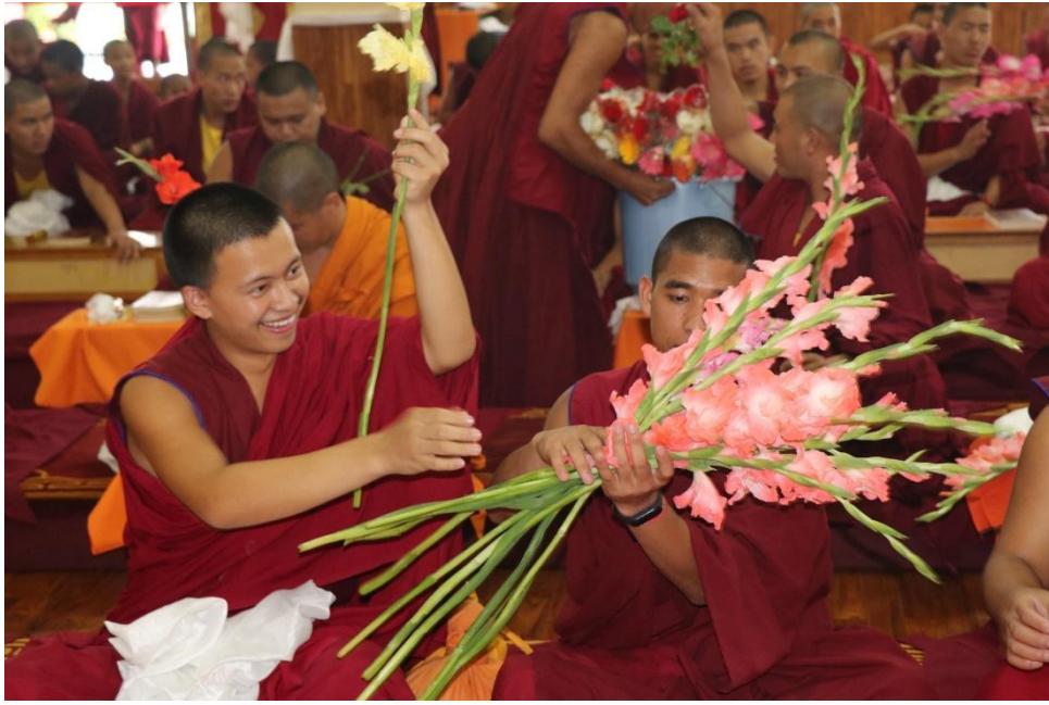
De traditionele bloemen offerande tijdens het ritueel van de verlichtingsgeest, augustus 2022